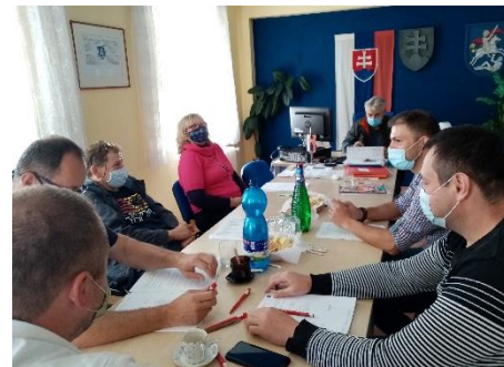
Kvôli pretrvávajúcej pandémie ochorenia COVID-19 priebežne zasada Krízový štáb obce Dolná Poruba.